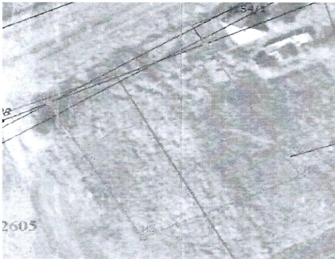
Схема № 1