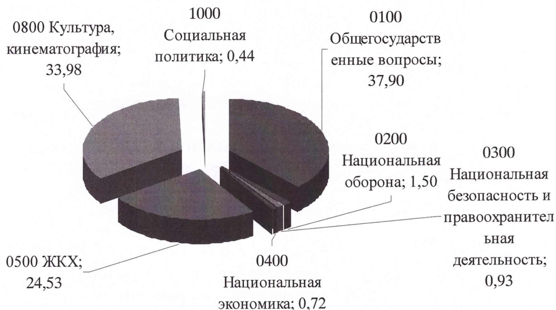
Рисунок 3 – Структура расходов бюджета поселения за 2012 год, %

По структуре расходы поселения за 2012 год распределяются следующим образом: