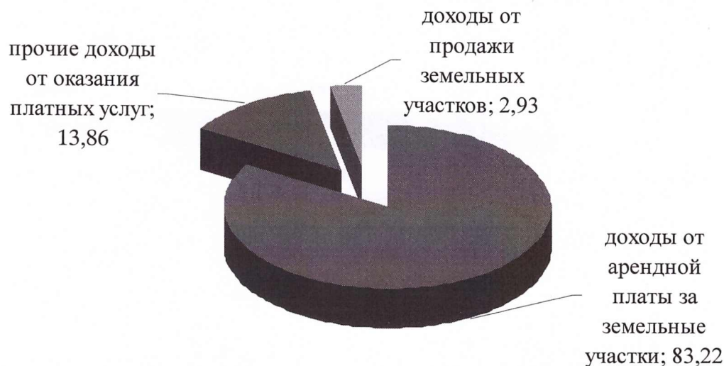
Рисунок 2 - Структура неналоговых доходов бюджета поселения за 2012 год, %

В общей структуре доходов неналоговые доходы занимают 0,96%, по структуре неналоговые доходы распределяются следующим образом: